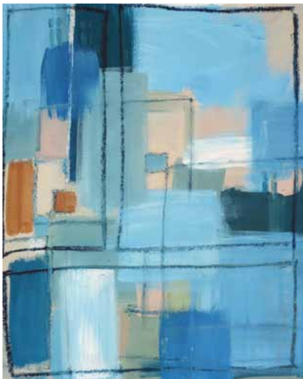
På rejse hjem