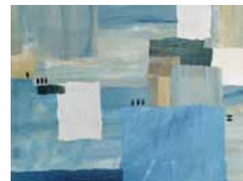
Serie af collager på lærred, 2022 Ovenfor til venstre: Vinterlys 05, 120 x 100 cm Til højre: Vinterlys 04, 25 x 25 cm Nederst: Vinterlys 03, 25 x 25 cm Nederst fra venstre mod højre: Vinterlys 06, 30 x 30 cm Vinterlys 09, 30 x 50 cm Vinterlys 07, 25 x 25 cm Vinterlys 01, 100 x 80 cm