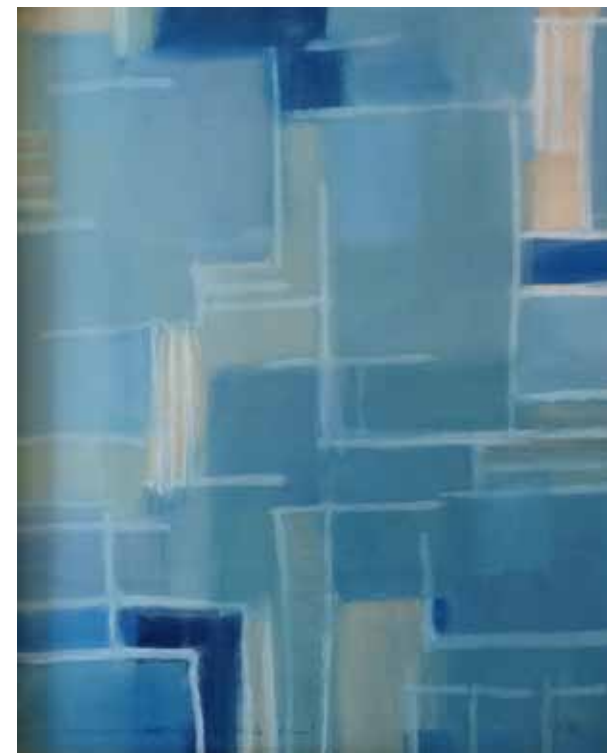
Hvad er der tilbage, når vi rejser?

Alle malerier i denne serie: æggetempera og olie på grundet akvarelpapir, 30 x 40 cm, 2023