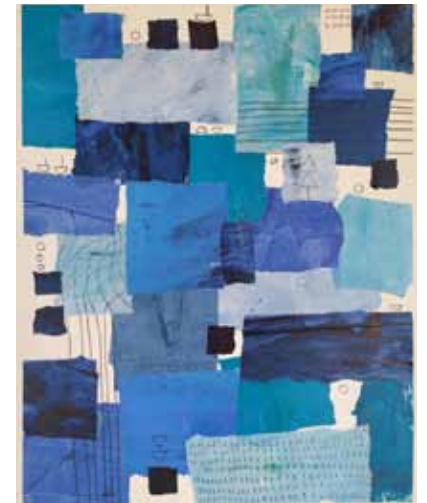
Uddrag af en serie på 12 collager på papir Fra venstre og opefter: Baltic Blue 10, 11 og 12, hver 30 x 40 cm Nedenfor: Blue Joy, 30 x 20 cm. Collage, malet papir på akvarelpapir, tegning, 2021