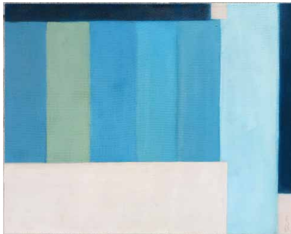
Serie Gåtur på stranden: Øverste række fra venstre mod højre: Nord, Syd, Vest, Øst, Æggetempera på jutelærred, 30 x 30 cm, 2023 Nederst til venstre: Bag øerne, højre: Søndagsvandring, begge æggetempera på jutelærred, 80 x 100 cm, 2023